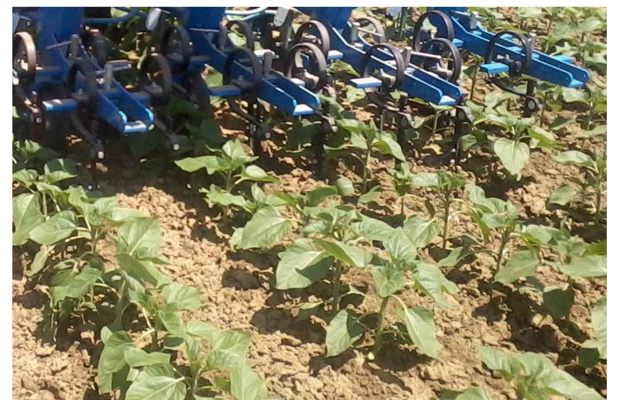
Binage du tournesol

Réduction de 2/3 d'herbicides au moment du semis Bonnes performances technico-économiques pour le désherbage