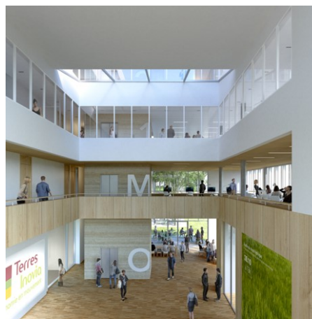
Vue de l'atrium

Ce contrat porte sur la construction de 2500 m 2 de bureaux (lot C1.1B) au sein du quartier de l'Ecole polytechnique, à Palaiseau, à proximité de la future gare de la ligne 18 du métro du Grand Paris. L'aménagement intérieur a été imaginé de sorte à favoriser le travail collectif, et à faciliter les échanges entre les collaborateurs de Terres Inovia / Terres Univia avec les étudiants, les chercheurs, et les porteurs de projets innovants autour de la foodchain. Les espaces de travail seront ainsi conçus pour être variés , avec des plateaux de travail collaboratifs mais aussi des zones de confidentialité ainsi que de grandes salles de réunion, dotées des dernières technologies numériques. Dans cette même configuration, le bâtiment comportera également un incubateur, un laboratoire d'idée et une zone de prototypage destinés à accueillir notamment les élèves et chercheurs du Campus Agro Paris-Saclay.