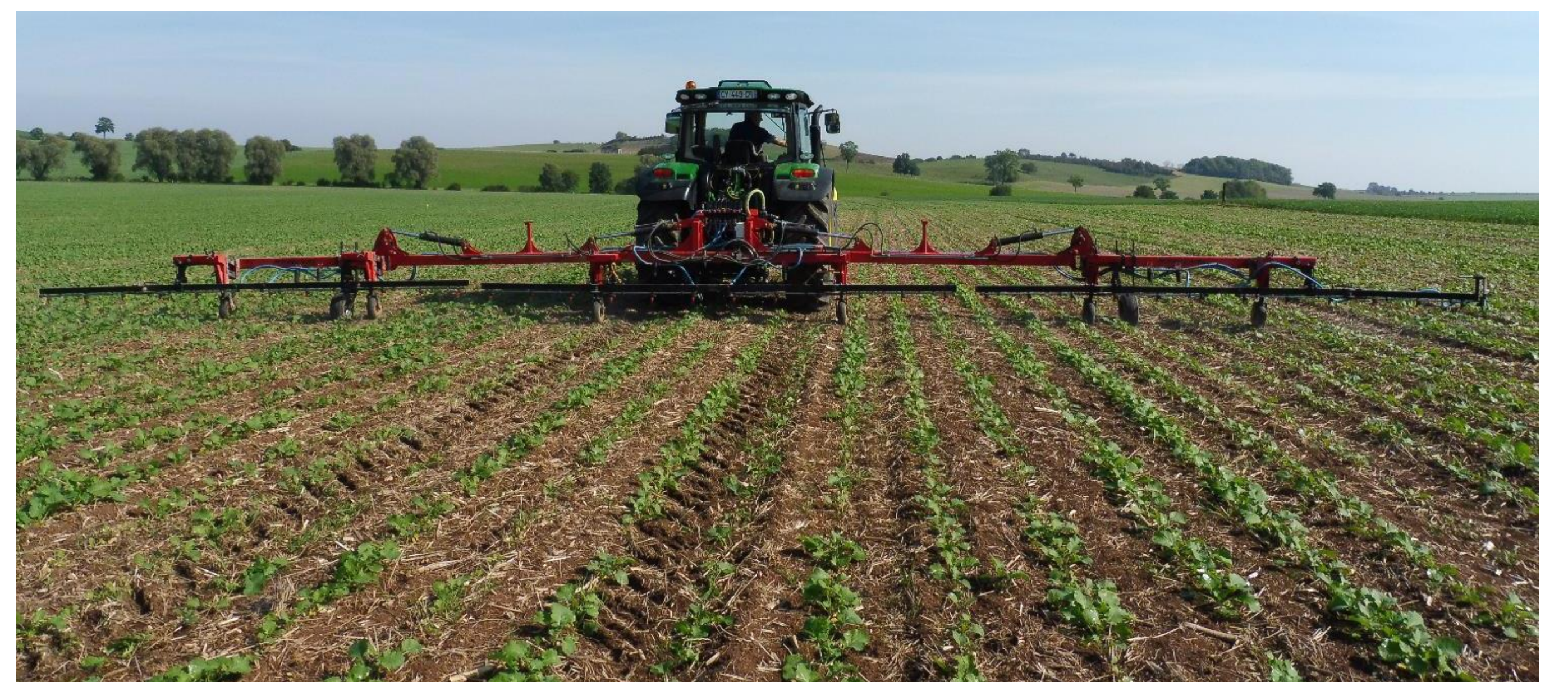
Rampe de pulvérisation localisée sur le rang